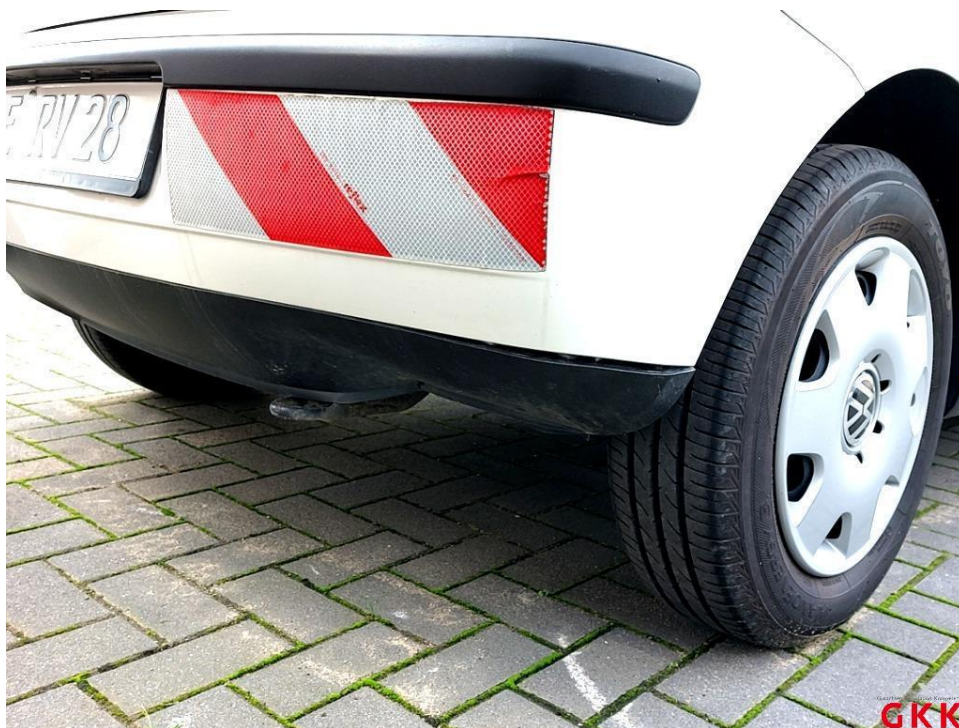
Bild 23 Stoßfänger hinten, Verkleidung unterhalb -unlackiert-, verformt, ersetzen