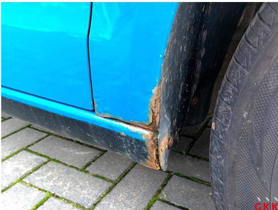
Bild 22 Kotflügel vorne rechts, korrodiert, lackieren