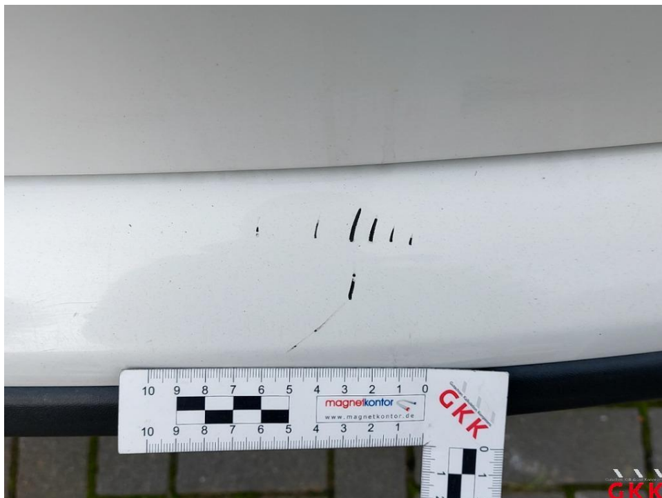
Bild 16 Stoßfänger hinten, Verkleidung -lackiert-, verkratzt, lackieren