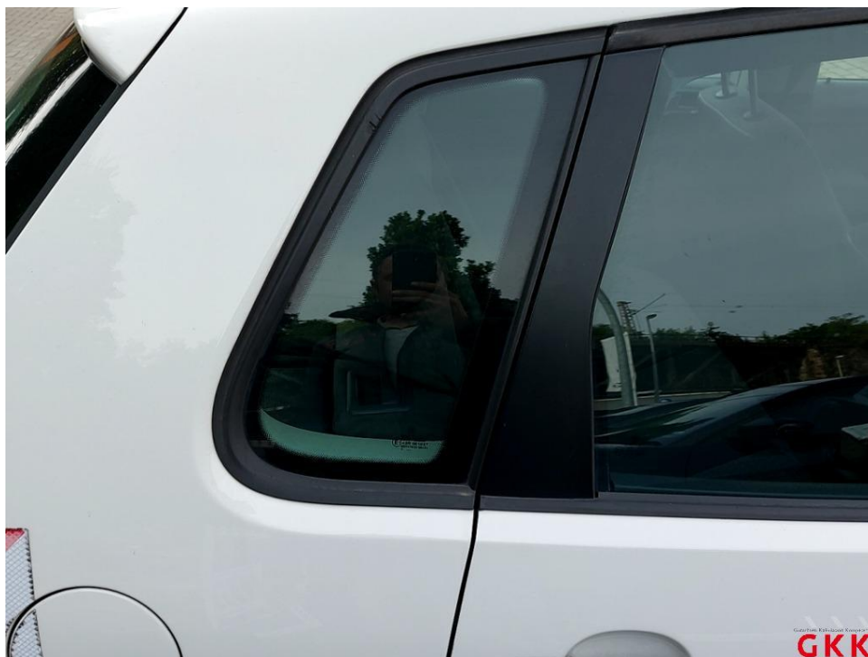
Bild 27 Seitenwand rechts, Scheibe -Rahmen-, beschädigt, ersetzen