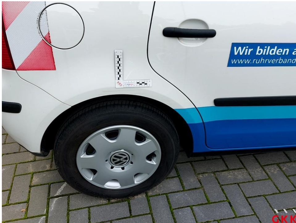
Bild 25 Seitenwand rechts, verkratzt, Smartrepair