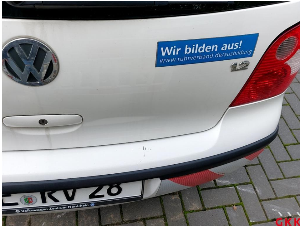
Bild 15 Stoßfänger hinten, Verkleidung -lackiert-, verkratzt, lackieren