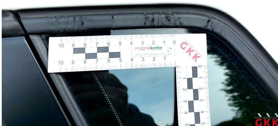
Bild 18 Seitenwand links, Scheibe -Rahmen-, beschädigt, ersetzen