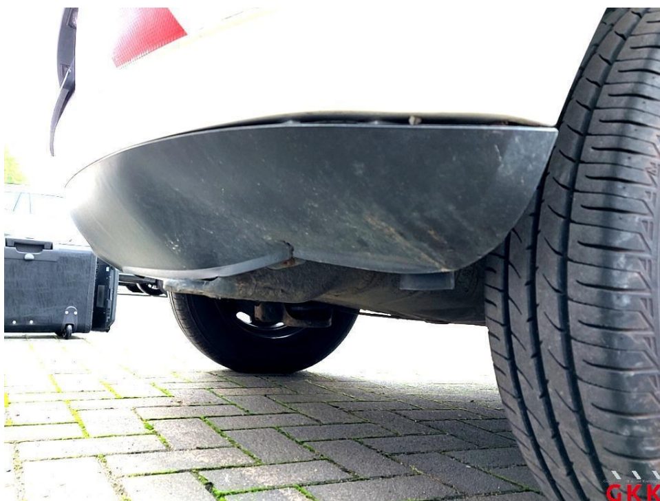
Bild 24 Stoßfänger hinten, Verkleidung unterhalb -unlackiert-, verformt, ersetzen