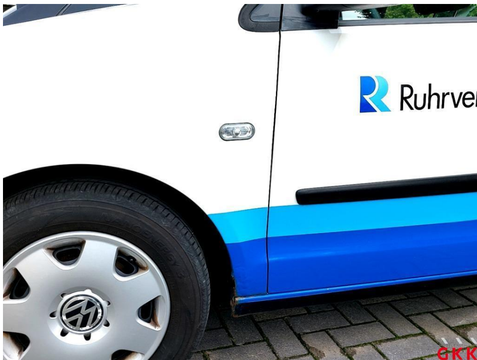
Bild 19 Kotflügel vorne links, korrodiert, lackieren