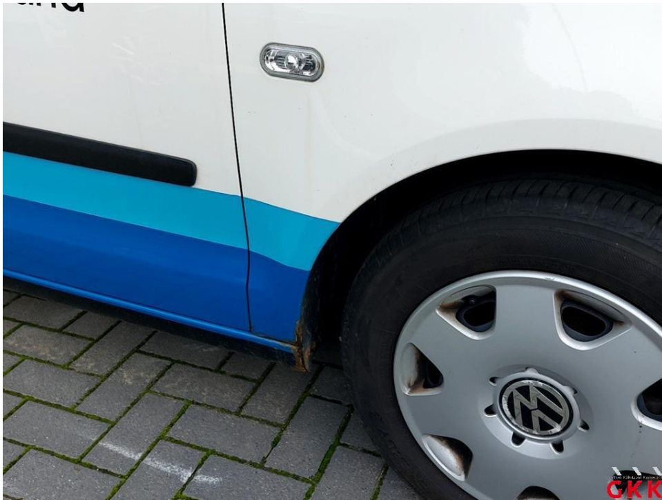
Bild 21 Kotflügel vorne rechts, korrodiert, lackieren