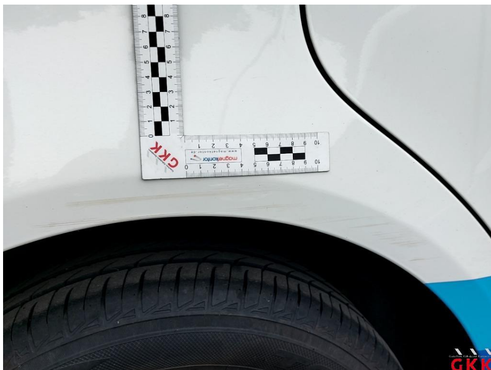
Bild 26 Seitenwand rechts, verkratzt, Smartrepair