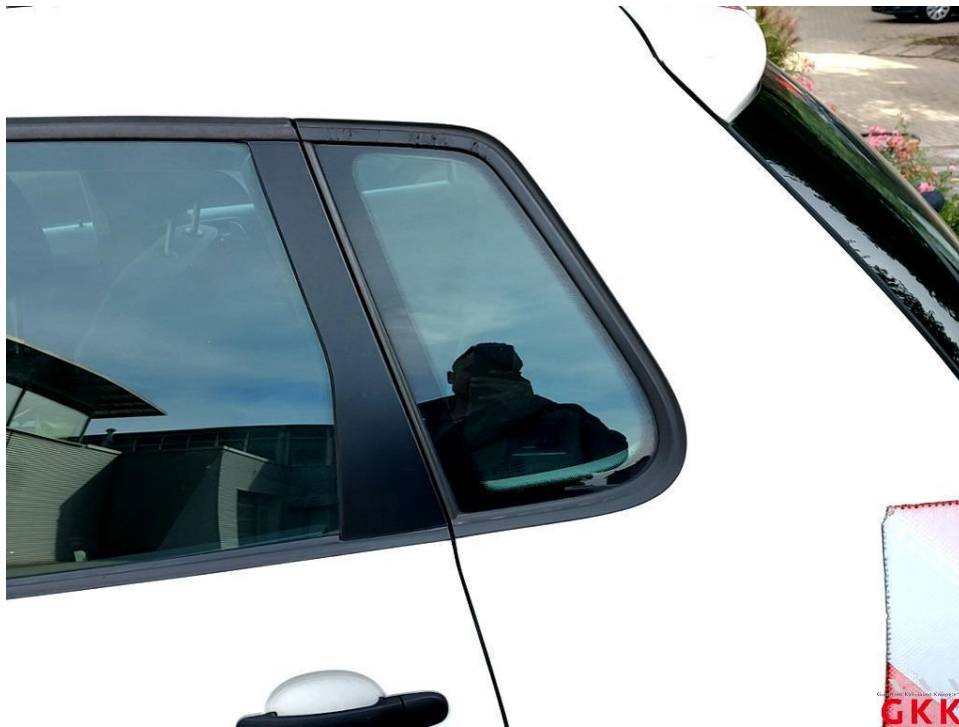
Bild 17 Seitenwand links, Scheibe -Rahmen-, beschädigt, ersetzen