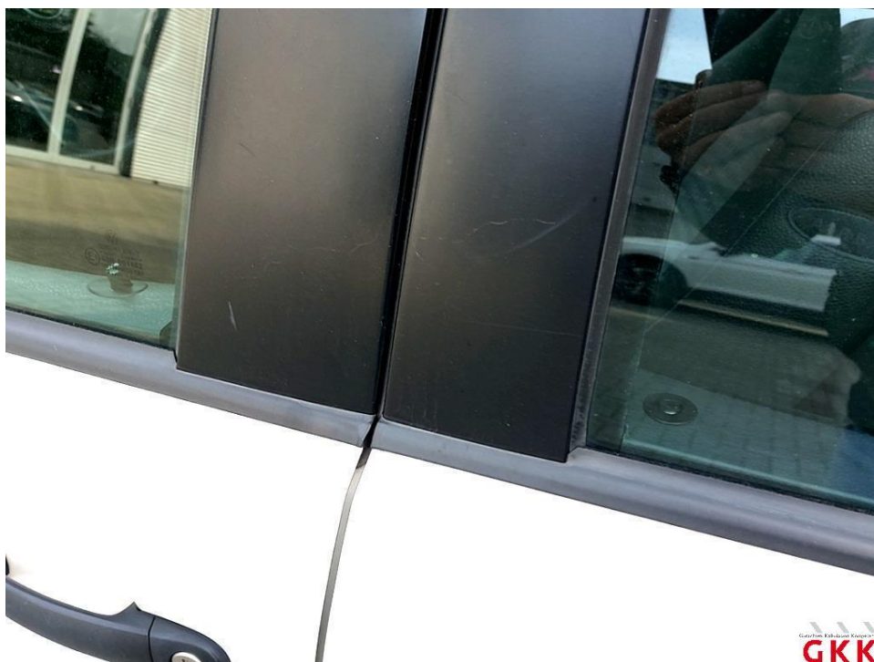
Bild 14 Schließanlage, funktionsuntüchtig, prüfen