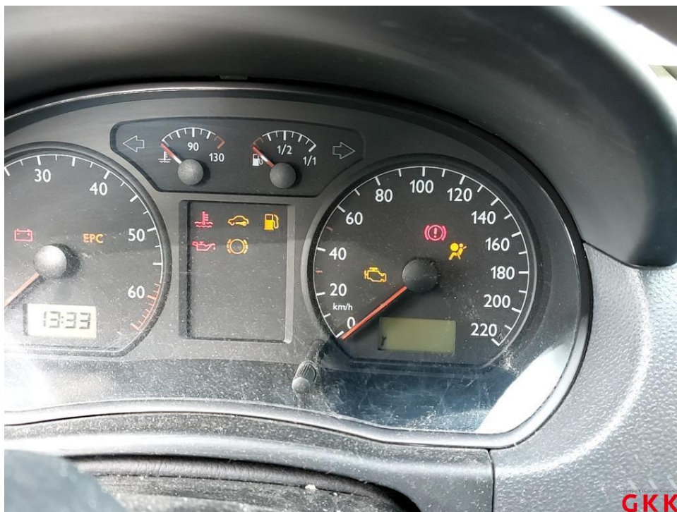
Bild 13 Motor, funktionsuntüchtig, prüfen