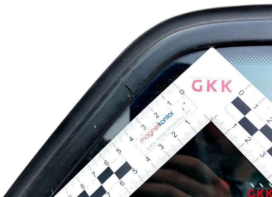
Bild 28 Seitenwand rechts, Scheibe -Rahmen-, beschädigt, ersetzen