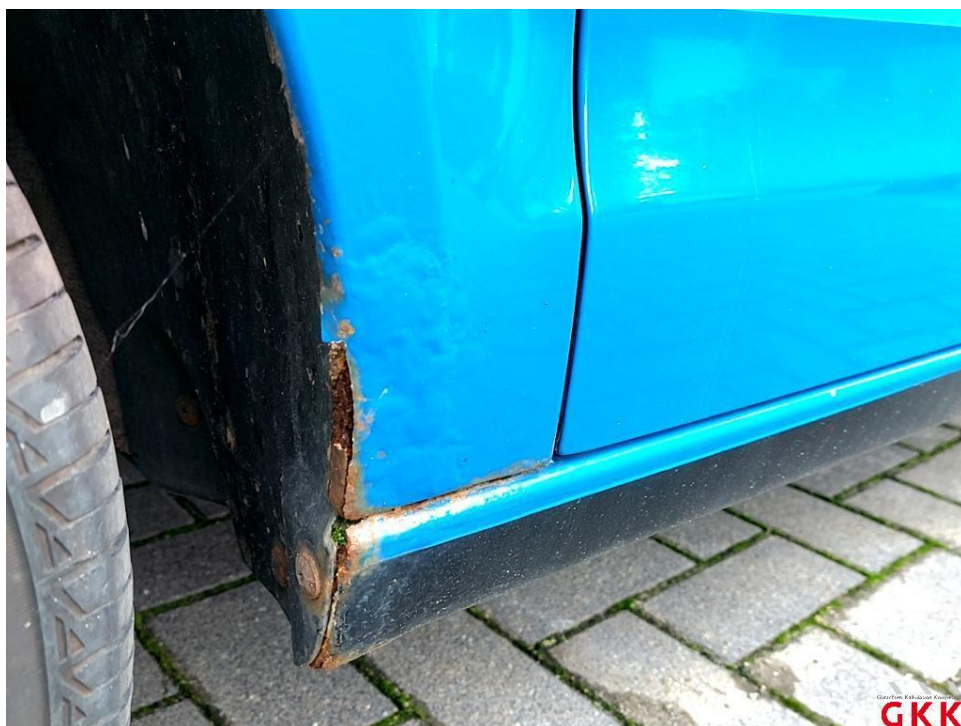
Bild 20 Kotflügel vorne links, korrodiert, lackieren